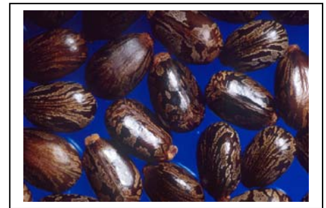
Rizinussamen / Castor bean